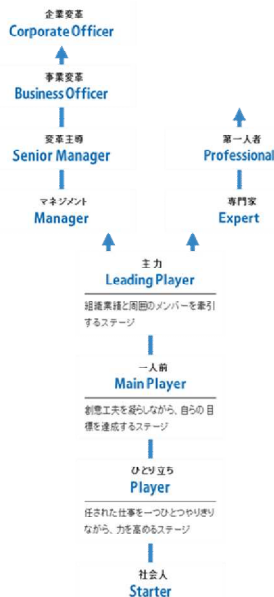
図表 1 : 10 のステージ